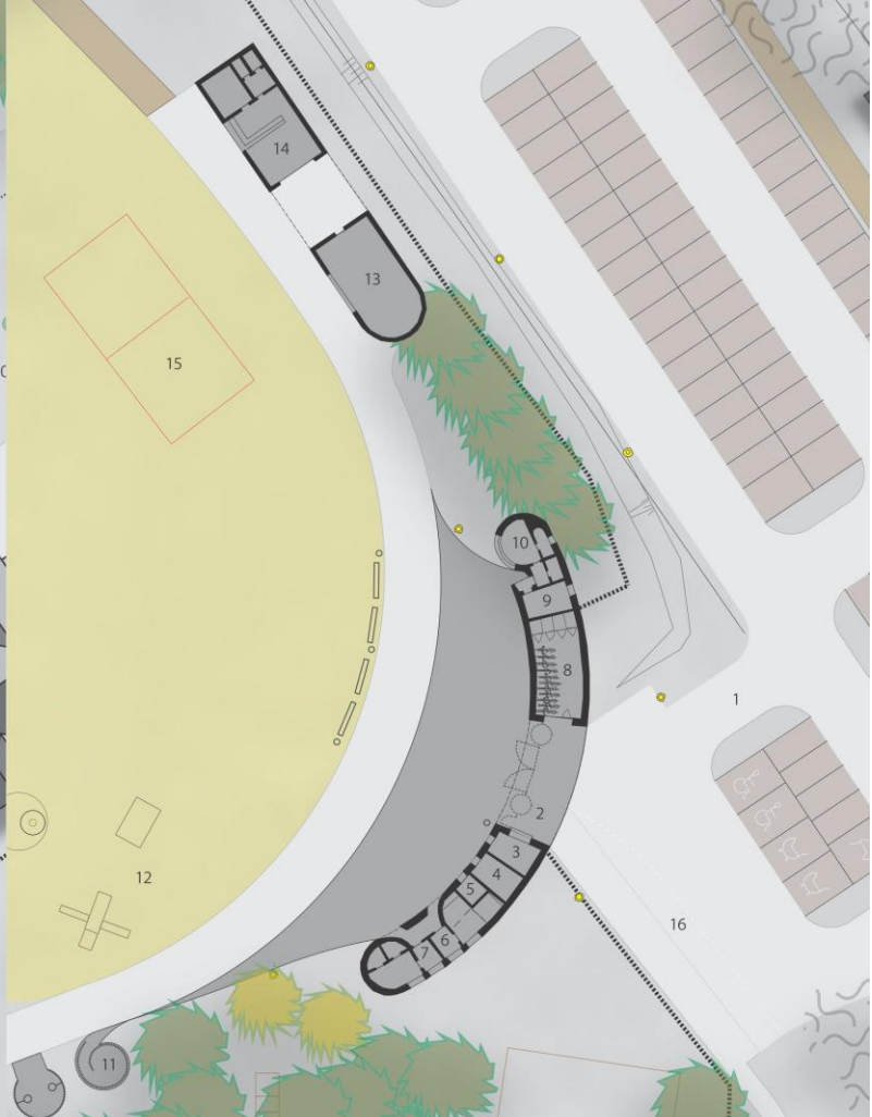
SITUACE VSTUP OTVICKÁ PLÁŽ M 1:250