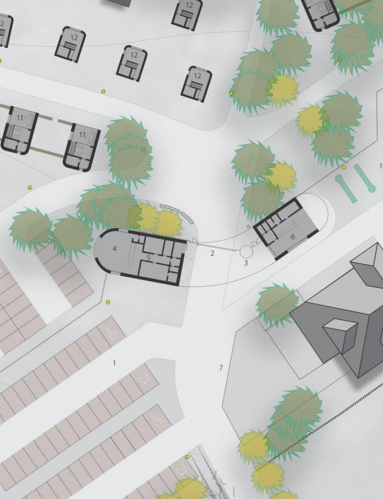
SITUACE VSTUP KEMP M 1:250